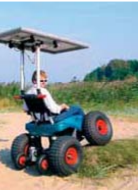
Strandrollstuhl mit Solarantrieb: Das CadKat mit Ballonrädern passt ohne Mühe in eine Wohnmobil-Heckgarage.