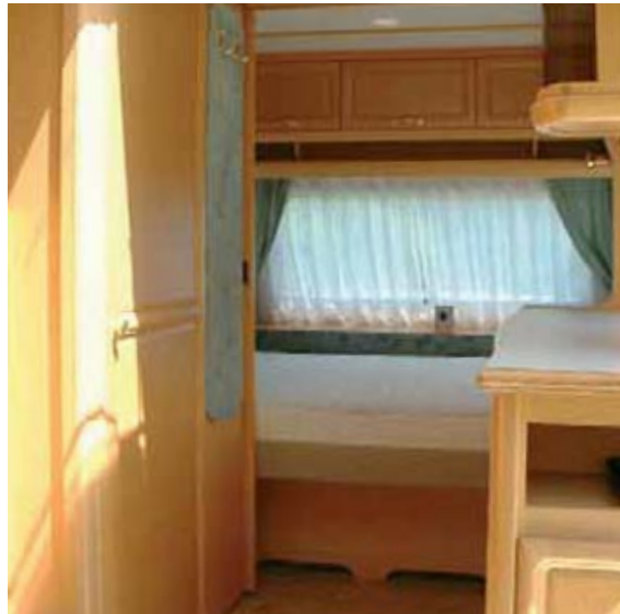
Festbett bei Grimm: Klassisches Doppelbett im Fahrzeugheck, Heizungsluft entströmt Lüftungsschlitzen unter dem Bett.

Weit verbreitet sind Sitzecken, die zu Doppel- oder