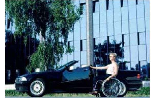
Fahren und Genießen im optimal umgerüsteten Cabrio.

Fall den Gutachter sorgfältig auswählen oder sich direkt an den Vertrauensmann für körperbehinderte Kraftfahrer in Deutschland, Oliver Raach, wenden (seine Kontaktdaten finden Sie auf Seite 64).